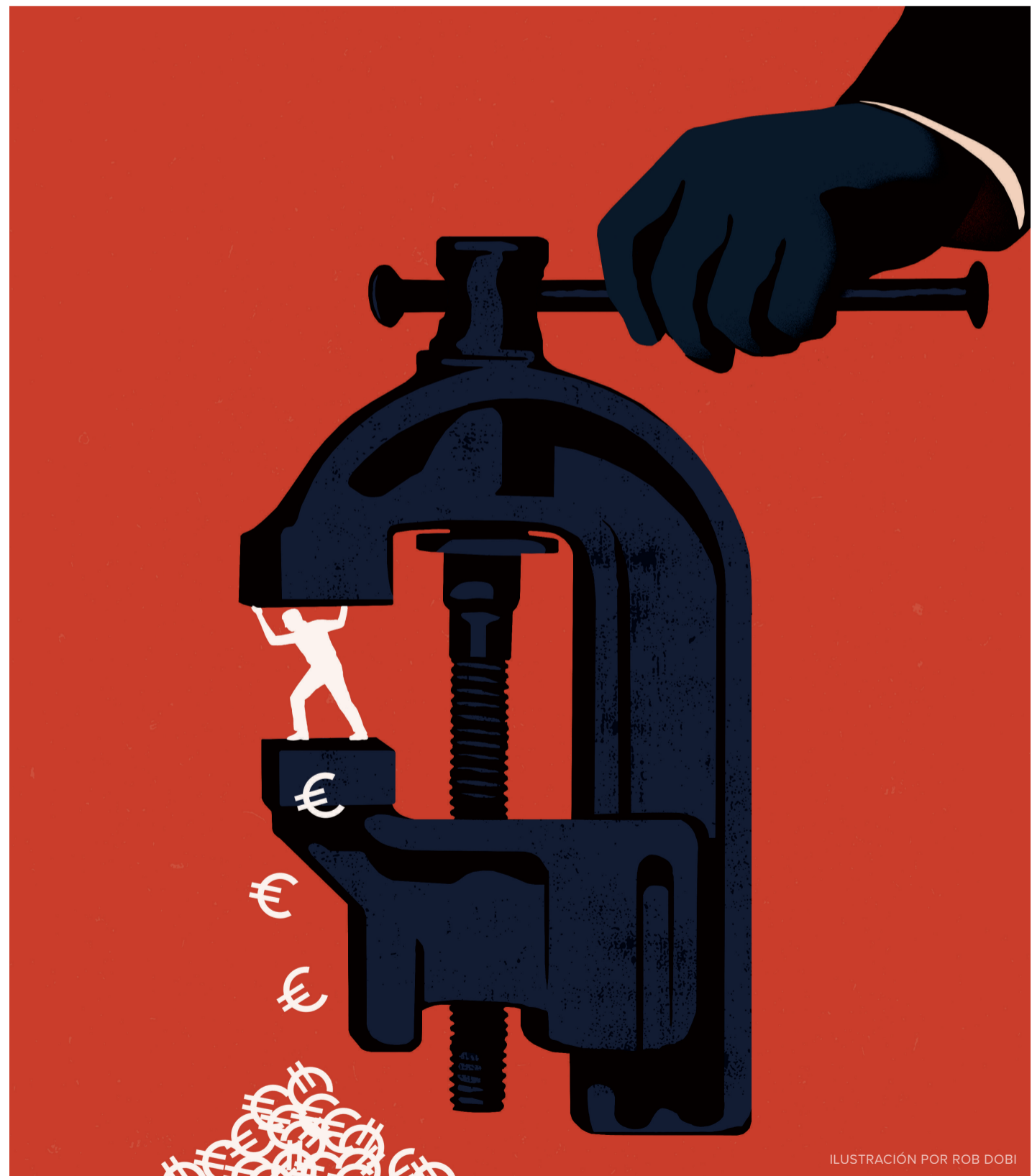
ILUSTRACIÓN POR ROB DOBI