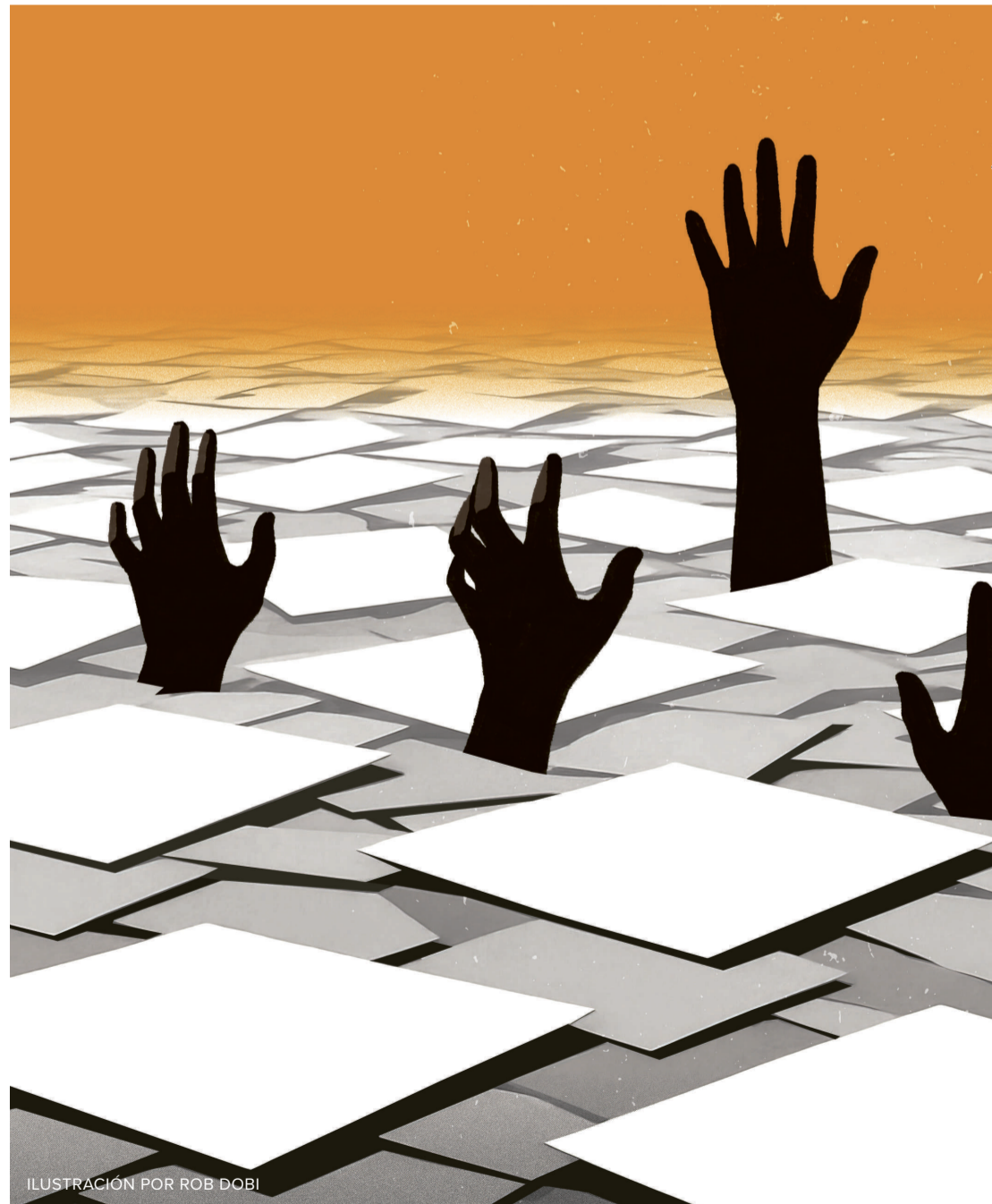
ILUSTRACIÓN POR ROB DOBI