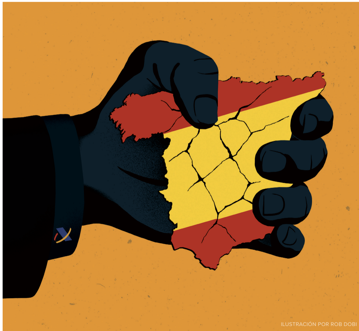
ILUSTRACIÓN POR ROB DOBI

La mayoría de las personas no son, ni quieren ser, expertas en tributación. En general, basta con saber que el sistema tributario funciona como debería y que es tan justo y progresivo como lo exige la Constitución de 1978. Sin embargo, es necesario que los ciudadanos participen al menos